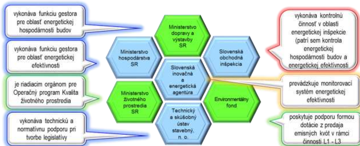
Graf č. 1: Rozdelenie kompetencií

dené v Grafe č. 1 a sú označené zelenou farbou. V súlade s § 22 ods. 1 zákona NR SR č. 39/1993 Z. z. o NKÚ SR v znení neskorších predpisov boli vyžadované informácie od MH SR, SIEA a SOI.